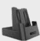
■ 94A150095 однослотовая док-станция