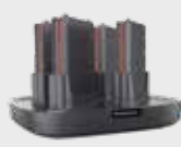
■ 94ACC0192 зарядное устройство на аккумулятора